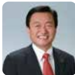
大西 秀人 高松市長

1959年、香川県生まれ。自治省、国土庁、総務省を経て、2007年5月より高松市長に就任。現在4期目。市長就任以来、すべての市民が暮らすことに誇りの持てる「瀬戸内創造拠点都市(クリエイティブ・コア)・高松」のさらなる進化を目指し、各種施策の推進に全力を注ぐ。