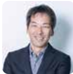
森田 桂治氏 たかまつ移住応援隊 移住リーダー

1959年、香川県生まれ。自治省、国土庁、総務省を経て、2007年5月より高松市長に就任。現在4期目。市長就任以来、すべての市民が暮らすことに誇りの持てる「瀬戸内創造拠点都市(クリエイティブ・コア)・高松」のさらなる進化を目指し、各種施策の推進に全力を注ぐ。